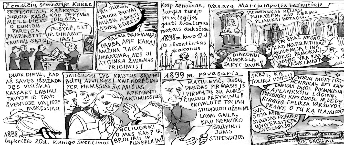
Autorinės teisės katalikiško mėnraščio šeimai „ARTUMA“. Parašė ses. O. Vitkauskaitė MVS, nupiešė S. Knezkytė (bus daugiau).