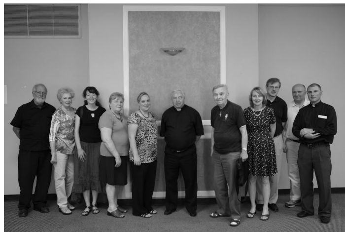
Susirinkimo dalyviai.

AKIMIRKOS IŠ BIRŽELIO 12 D. VYKUSIO EUROPOS (ČIKAGOS VYSKUPIJOS) TARYBOS SUSIRINKIMO