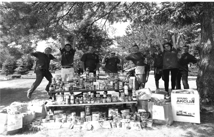
Maistas vargšams, surinktas Gerumo akcijos metu.