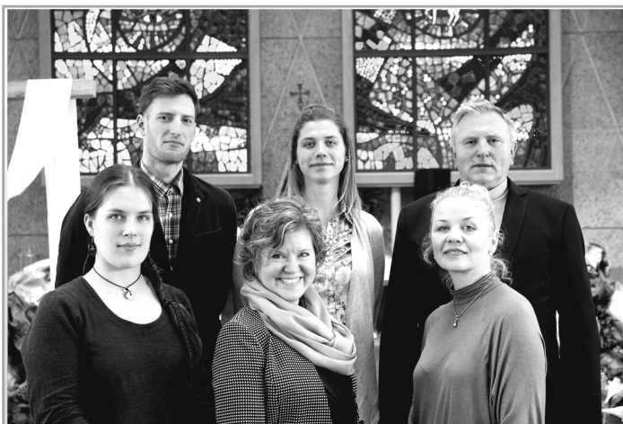
PJM misiją aplankė „Jėzuitų plėtros projekto“ svečiai.

Motinos dienos novena prasideda sekmadienį gegužės 1-ąją ir baigsis antradienį gegužės 10-ąją dieną. Sekmadieniais šv. Mišios novenos intencijomis bus aukojamos 6 val. v., o šio kiadieniais – 8 val. r. Užrašytus vardus galima paduoti raštinėje ar įrašyti prie įėjimo į bažnyčią padėtuose vokeliuose. Vokeliai visas novenos dienas bus padėti ant altoriaus, meldžiantis už mūsų brangias gyvas ir mirusias motinas.