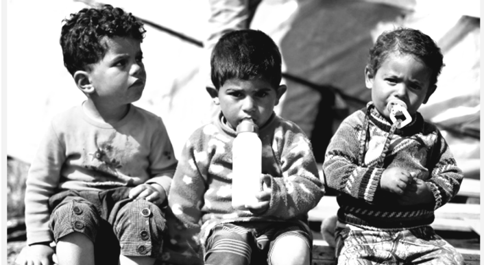
Nuotraukoje: šių laikų pabėgėliai iš Sirijos

„Migrantai ir pabėgėliai – iššūkis. Atsakas – gailėstingumo Evangelija.“ Popiežius Pranciškus