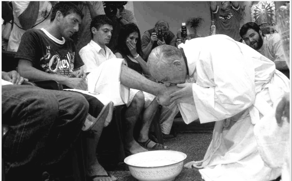
Būdamas kardinolu Šventasis Tėvas bučiavo ir plovė narkomanų prieglaudos rezidentų kojas.

„Bažnyčia smerkia nuodėmę, tačiau apkabina nusidėjėlį.“ Reikia atleisti septyniasdešimt septynis kartus, sako Pranciškus. O tai reiškia visada, nes