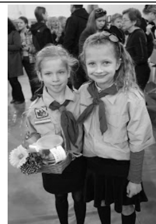
Kaziuko mugė Pasaulio lietuvių centre Lemonte.