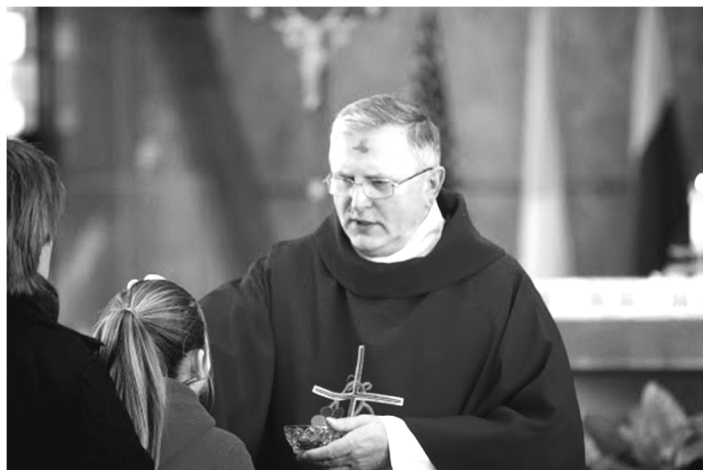
Pelenų trečiadienis 2014 m. kovo 5 d. Palaimintojo Jurgio Matulaičio misijoje.

9 val. r. $ 2145 11 val. r. $ 1257 6 val. v. $ 347 Paštu $ 130