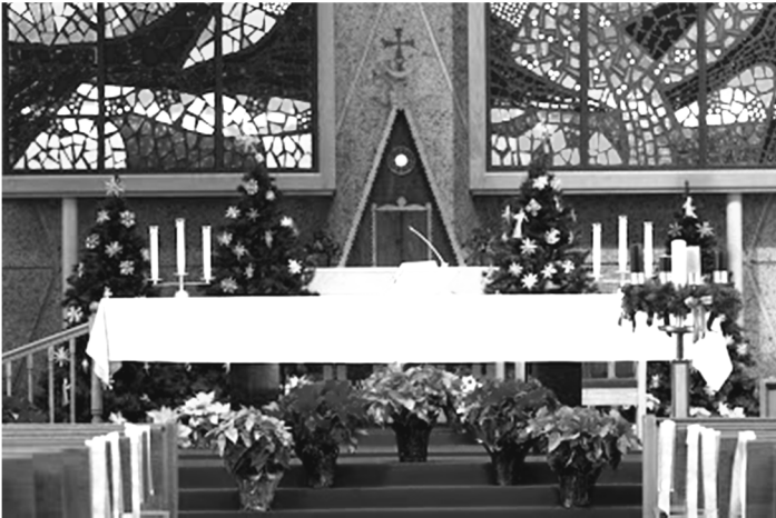
Palaimintojo Jurgio Matulaičio misijos altorius, papuoštas Kalėdoms. Už jo –t abernakulio saugojimo vieta.

Atsisėdę bažnyčioje į suolą, prieš akis matome tam tikros formos stalą. Tai – altorius, svarbiausia bažnyčios dalis. Tai – kulto reikmėms skirtas baldas, naudojamas religiniam aukojimui; vieta, kurioje atliekamos religinės apeigos. Altorius yra viena iš švenčiausių vietų visoje bažnyčioje. Ant jo duona ir vynas per šv. Mišias tampa Jėzaus Kristaus Kūnu ir Krauju.