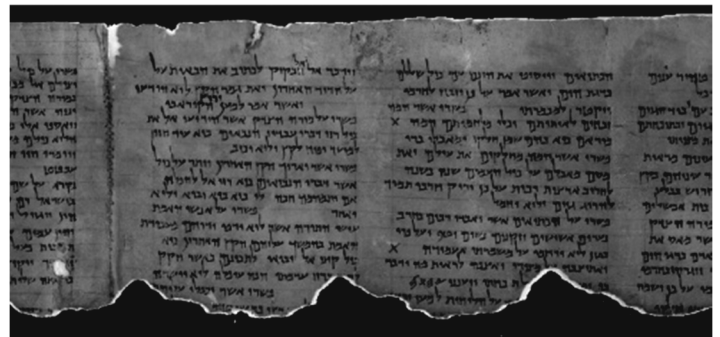
Senojo Testamento knygos ištrauka, parašyta hebrajų kalba I a. prieš Kristų.