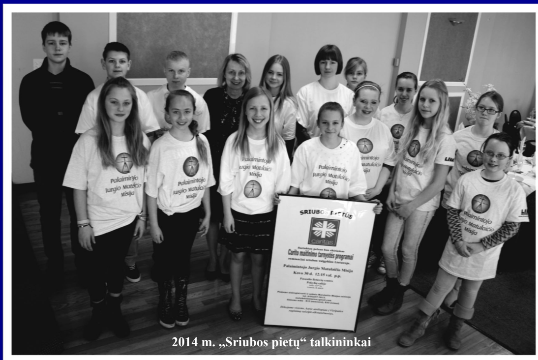
2014 m. „Sriubos pietų“ talkininkai

14911 - 127th St., Lemont, IL 60439 Tinklapis: www.matulaitismission.com Tel.: 630-257-5613; el. paštas: matulaitismission@gmail.com