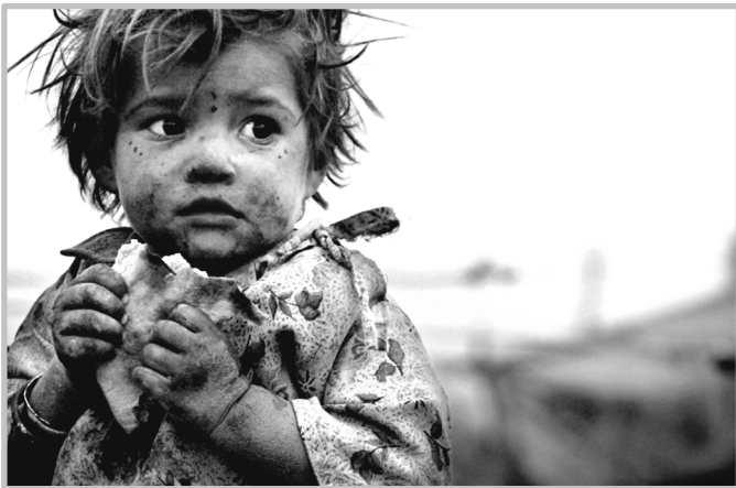
„Ryžių dubenėliai“ ir „Sriubos pietūs“ padeda alkstantiems.

Šiuo laikotarpiu svarbu prisidėti prie mūsų misijoje vykstančių tradicinių gavėnios vaju – „Sriubos pietų“ bei „Ryžių dubenėlio“. Abi iniciatyvos yra skirtos paremti labiausiai vargstančius, kurie yra priverstėti kęsti alkį, nes neišgali nusipirkti ar parsirūpinti maisto sau ir savo šeimoms. Visus misijos narius kviečiame gausiai dalyvauti ir prisidėti prie šių gerų darbų.