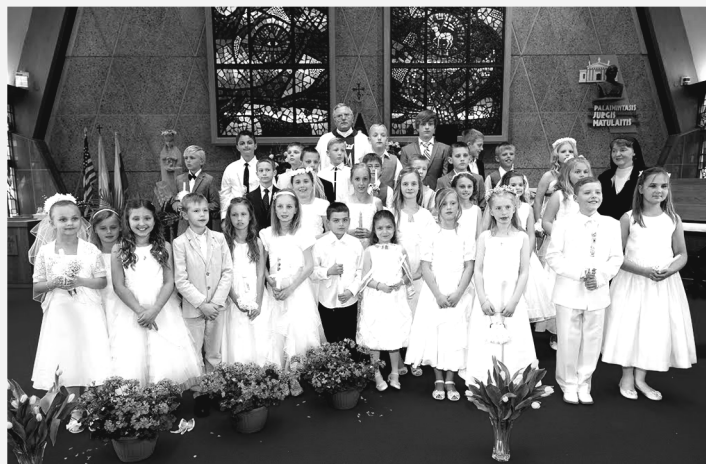
Gegužės 10 d., 1 val. p. p. grupė.