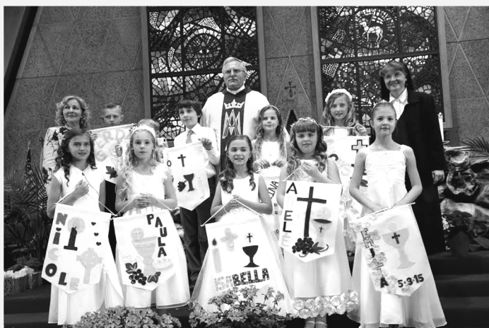
Gegužės 3 d., 11 val. r. grupė.