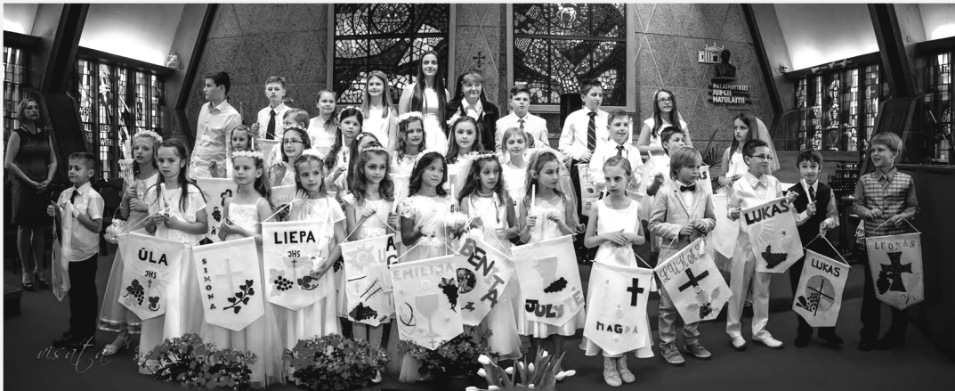
Gegužės 3 d., 1 val. p. p. grupė.